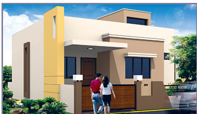
R-Executive 2 BHK, Row House