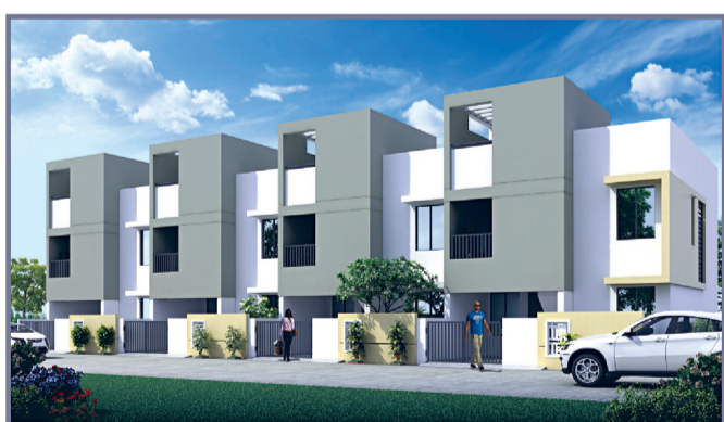
Z-Duplex Luxury 3 BHK, Row House