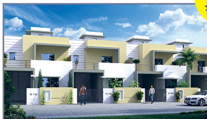
WR-Duplex Luxury 3 BHK, Row House